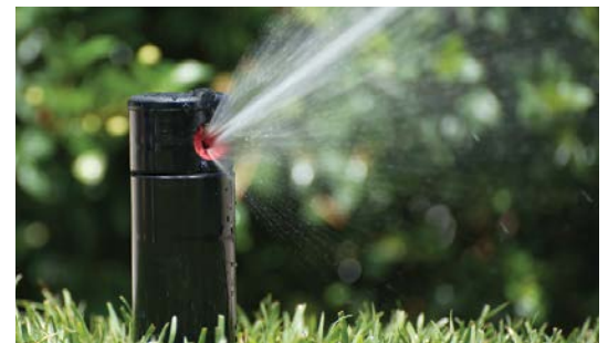
PGP Rote Düse