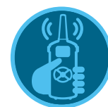
ROAM- Fernbedienung ROAM XL-Fern- bedienung