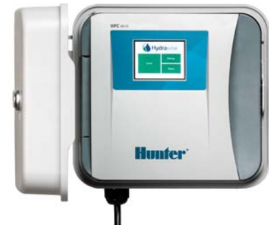
HPC (Kunststoff Innen-/Außenmontage) Höhe: 22,9 cm Breite: 25,4 cm Tiefe: 11,4 cm

Testen Sie die Hydrawise-Software direkt unter hydrawise.com